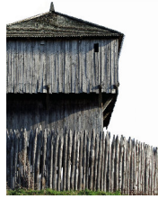
Beispiel eines hölzernen Wohnturms. Rekonstruierte Anlage in Saint-Sylvain-d'Anjou (FR).

Die archäologische Fundstelle im Heimberger Buechwald ist frei zugänglich und kann über den Forstweg erreicht werden. Die Informationstafeln vor Ort geben einen Überblick über die Anlage und ihre Geschichte. Zudem lädt eine Sitzbank zum Verweilen ein.